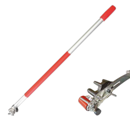
SPEEDY ROLL glejte stran 389