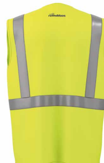
VESTYZIPM VESTYZIPL VESTYZIPXL VESTYZIPXXL