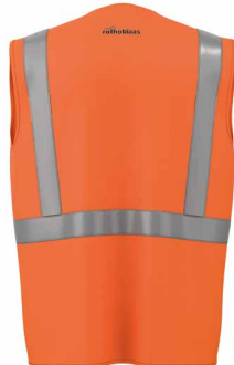
VESTOZIPM VESTOZIPL VESTOZIPXL VESTOZIPXXL